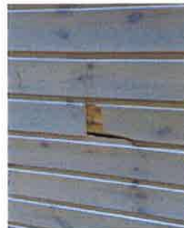
Hol i vegg i gymsal. Dårleg utført arbeid

Store kapasitetsproblem 23 punkt som må vurderast utbetra Bør få lås på medisinskap