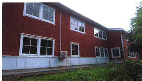
Manglande brannstige på to av klasseromma