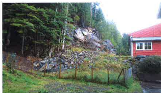
Manglande opprydding etter arbeid