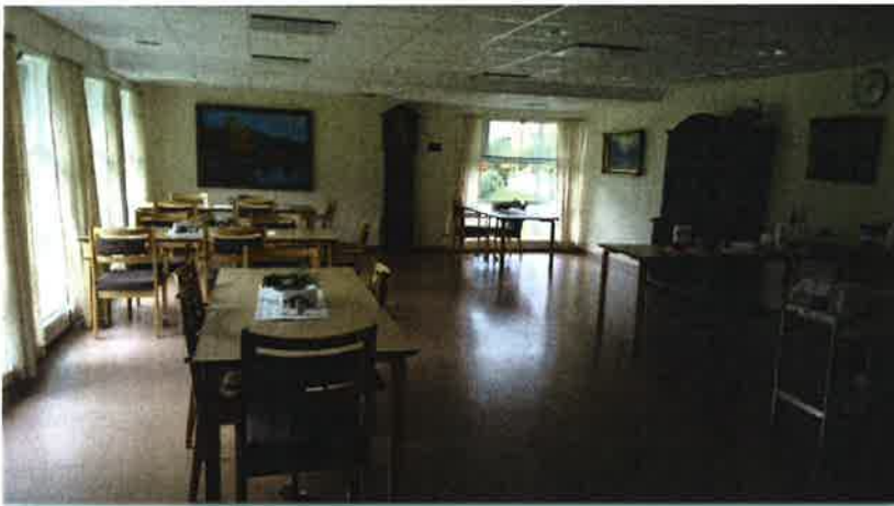
Matsalen i første etasje.