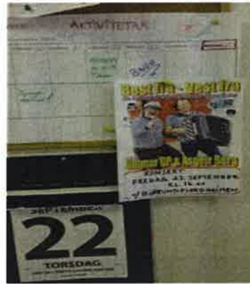
I gangen finn ein vekeoversikt over aktivitetar.