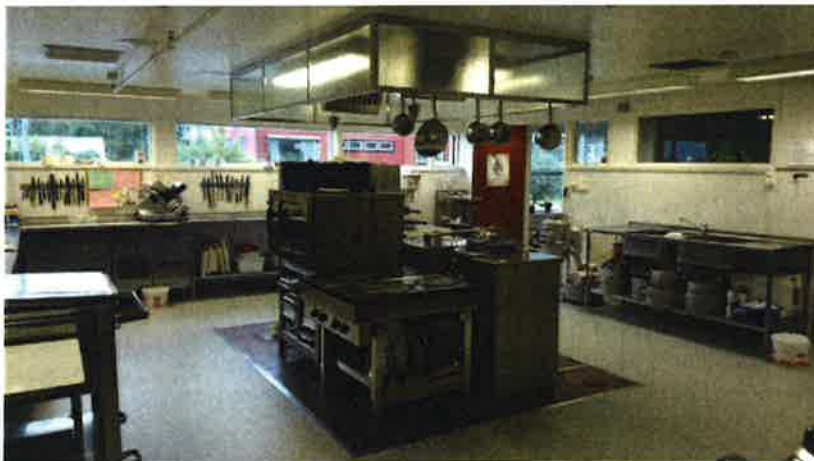
Hjørundfjordheimen har eit stort kjøkken som bar preg av god orden.