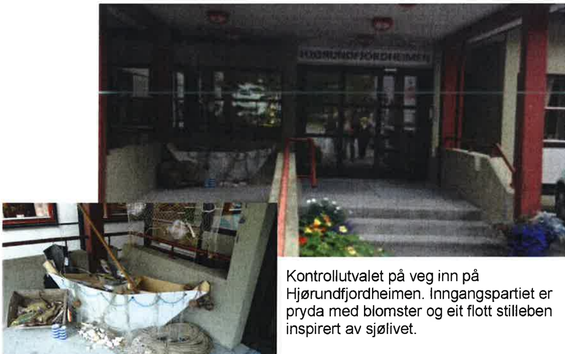
Kontrollutvalet på veg inn på Hjørundfjordheimen. Inngangspartiet er pryda med blomster og eit flott stilleben inspirert av sjølivet.

Etter orienteringa var det omvisning på Hjørundfjordheimen og tilhøyrande uteområde.