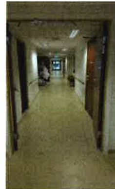
Frå gangarealet i andre etasje.