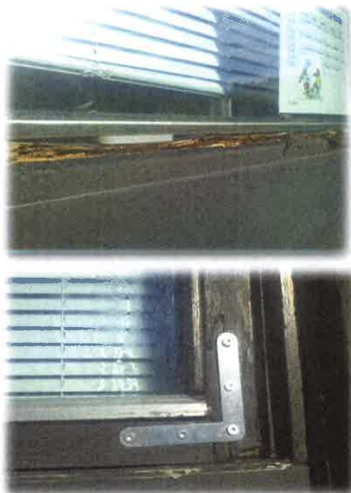
Bilde 1: Rotskader vindage på adm.fløy

Vedlikeholdssituasjonen ved Leikanger skule må ut i frå ei totalvurdering av interessentane sine svar og revisjonen sin gjennomgang vurderast som variabel. Den daglege drifta fungerer og er under kontroll, men ein ser etterskot på enkelte større vedlikehaldsoppgåver. Ein del vedlikehaldstiltak og utskiftingar har vore gjort som blant anna legging av nytt tak på administrasjonsdelen, samt at det meste av skulen har vore mala i seinare tid. Ein ser derimot at fleire av vindauge på administrasjonsdelen må skiftast pga. roteskader. Ein har også problem med lekkasje i overgangen mellom grendehuset og skulen.