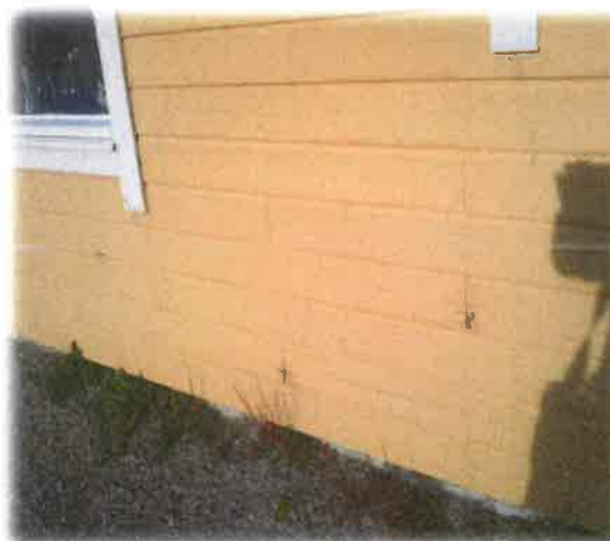
Bilde 10: Utvendig fasade bør beisast/ utbetrast

Vedlikeholdssituasjonen ved Myrsnipa barnehage må ut i frå ei totalvurdering av interessentane sine svar og revisjonen sin gjennomgang vurderast som variabel/god. Den daglege drifta fungerer og er under kontroll. Ein registrerar naturlegvis større slitasje på den eldste delen av bygget. Dette gjeld spesielt utvendig fasade (bordkledning) der maling og utskifting av enkeltbord (roteskader) burde prioriterast. Leiar for drift hevdar at for å vere eit 20 år gammalt bygg er vedlikeholdet og tilstanden på bygget generelt godt, og ein ser ingen vedlikehaldsoppgåver som krev strakstiltak.