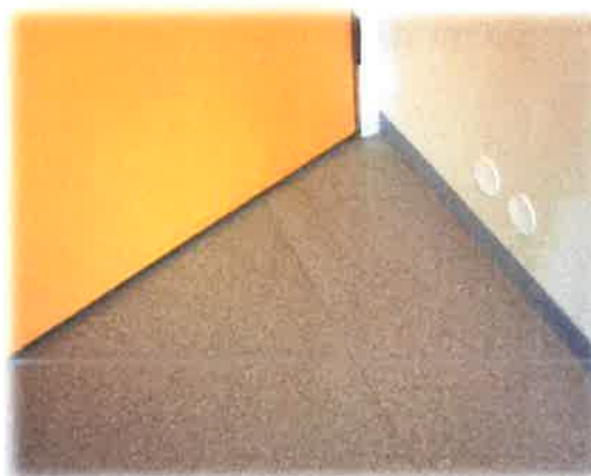
Bilde 16: Golvbelegg som bølger seg

I samband med utbetring av taket bør også det som finnast av utvendig bordkledning skiftast (sjå bilde). Ein registrete også ein del dårlege pakningar på enkelte vindaug mot Myrnsnipa barnehage som bør skiftast.