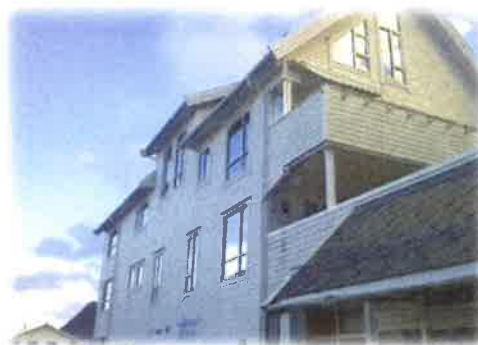
Bilde 23: Utvendig fasade Holmsild

Vedlikeholdssituasjonen ved Holmsild brygge må ut i frå ei totalvurdering av interessentane sine svar og revisjonen sin gjennomgang vurderast som god. Av vedlikehald som bør prioriterast er utvendig maling av bygget. Leiar drift hevdar det er planlagt maling av bygget i 2014. Innvendig vert det hevda at leilegheitene er i god stand og at det ved sist skifte av leigetakar var det ingen merknader på overtakingsprotokollen. Kommunen har ikkje gjennomført større vedlikehaldsoppgåver ved leilegheitene dei siste åra. Det har berre blitt mindre oppgåver som for eksempel rengjering av terrasse og utskifting av lysrør osv.