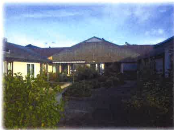
Bilde 14: Den "mørke" bordkledningen bør skiftast/malast.

Vedlikeholdssituasjonen ved Myrvåg sjukeheim må ut i frå ei totalvurdering av interessentane sine svar og revisjonen sin gjennomgang vurderast som variabel/god. Den daglege drifta fungerer og er under kontroll, og det meste av innvendig areal blei renoverert i 2007 og er i bra stand. Ein registrerar større slitasje på kjøkkendelen som ikkje var ein del av renoveringa i 2007. Dette gjeld golvbelegg, utvendige veggplater og tak. Ein har ein del utfordringar med taket der ein har problem med kaldluft i ventilasjonen som ikkje er kald nok. Dette førar til at taket vert for varmt og på vinterstid førar dette til smelting av snø og deretter danning av is ved kjøkkenfløya. Det finnast også eit lekkasjepunkt ved taket som bør utbetrast.