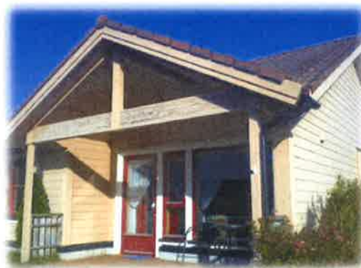
Bilde 17: Limtredrargar på bygga er i dårleg stand.

Vedlikeholdssituasjonen Myrvåg omsorgsbustadar må ut i frå ei totalvurdering av interessentane sine svar vurderast som variabel. Ein ser størst slitasje utvendig på bygga, der ein ikkje kan sjå at bygga har vore beisa sidan det var nytt. Dette har resultert i at enkeltbord på framsida har begynt å rotne. Beising og utskifting av enkeltbord kan derfor karakteriserast som strakstiltak. Innvendig i bygga og i leilegheitene er slitasten minimal noko som tyder på lette brukarar.