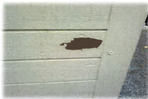
Bilde 8: Roteskader undervisningsbrakke

skulen hevdar ein har problem med styring av varme ved skulen, spesielt ved brakkebygget, noko som bør utbetrast. I vedlikehaldsplanen for 2013 ligg utbetring av lekkasjepunkt ved vindauga, maling av fasade og sikring av uteområde mot veg. I kommunen sitt førebels utkast til vedlikehaldsplan (2014-2017) er det planlagt utvendig maling av fasade.