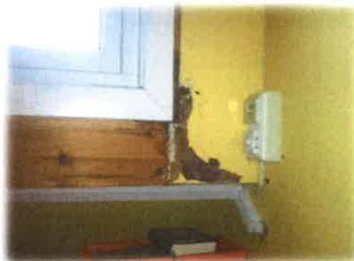
Bilde 7: lekkasje sløydsal/bibliotek

vidare skade. Ein registrete også at takstein på administrasjonsdelen var øydelagt og som bør utbetrast. I tillegg til roteskader på enkeltbord på brakkebygget.