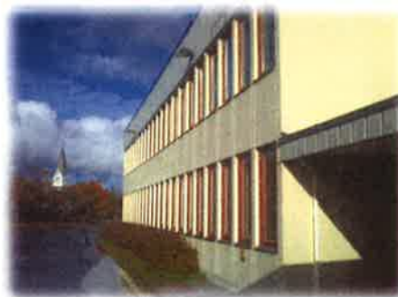
Bilde 4: Utvendig fasade som har vore pussa opp

Ungdomsskulen: Utvendig fasade mot hovudvegen har i seinare tid vore pussa opp (malt og sandblåst ved evt rustangrep osv), samt ein har fått skifta alle vindauga på eine sida av ungdomsbygget. Innvendig i andre etasje blei det bygt på ein personaldel for ca 2 år sidan. Det blei i den samanheng også fjerna ein vegg og lagt nytt golvbelegg i store delar av etasjen. I første etasje er det gjort få utskiftingar (golvfliser som held seg godt). Av strakstiltak som bør nemnast er ei lekkasje ved eit hjørne på ungdomsskulen som kjem ned i eit lagerrom.