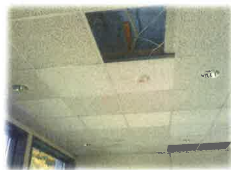
Bilde 2: lekkasje frå tak i overgangen mellom skule og grendahus

Div. arbeid i kjellar i samband med ombygging av sløydsal.