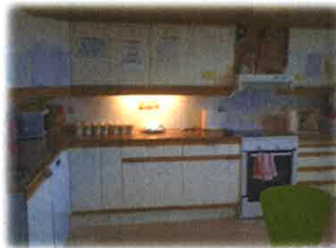
Bilde 13: Kjøkkenet ved barnehagen

Ein bør også følgje opp og ha ein gjennomgang av den nye personaldelen av barnehagen før garantien på dei ulike installasjonane løpar ut, slik at ei slepp å sitte med unødvendige kostnadar som kunne vore teke på garanti.