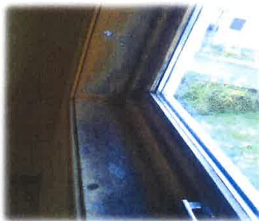
Bilde 19: Svertesopp i vindaugskarm

reingjere desse, eller om dei også må skiftast ut. Dei fleste innvendige veggflater bør også malast. Ein fant ein del svertesopp i vindaugskarmar og i hjørne på to av soveromma noko som tyder på lite lufting. Inngangsdører og garasje portar er i dårleg stand (en del roteskader) og bør også skiftast ut. I tillegg må enkeltbord skiftast utvendig pga. roteskader, og bygga bør malast.