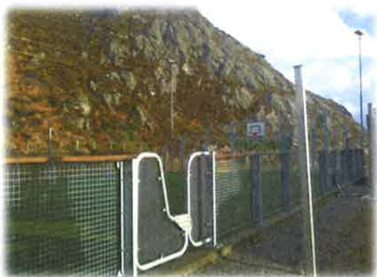
Bilde 24: Viketoppen ballbinge