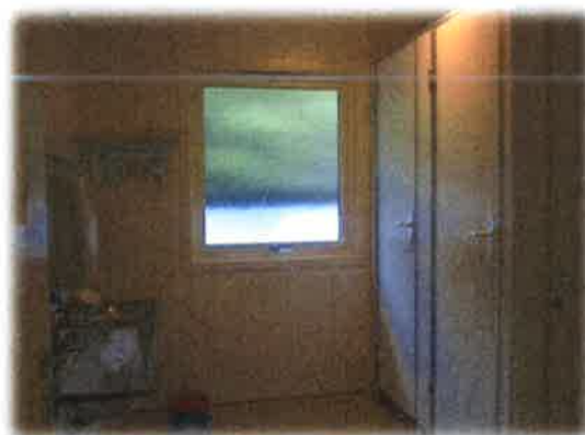
Bilde 12: Toalett

Barnehagen er knytt til områdevaktmeistertenesta, men har ikkje fast tilsyn. Styrar rapporterar inn avvik i FDV (forvaltning drift og vedlikehald)-systemet "Famac". Eigeomsavdelinga mottok avviket og organiserar tiltak. (sjå kap 4.2.1 for meir info kring systemet)