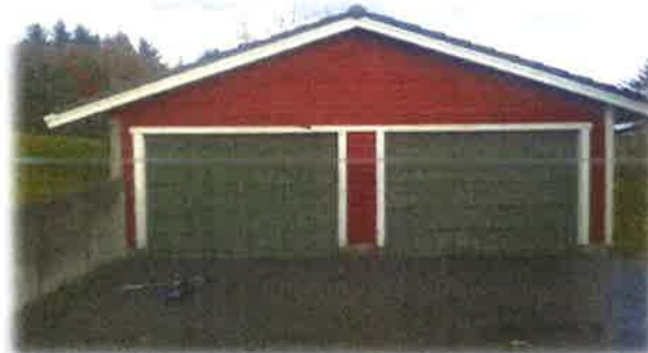
Bilde 20: Utvendig fasade er slitt

Av vedlikehold som bør prioriterast hevdar vaktmeistrane at ein del golvbelegg bør skiftast (hol) I tillegg bør utvendig fasade malast (strakstiltak).