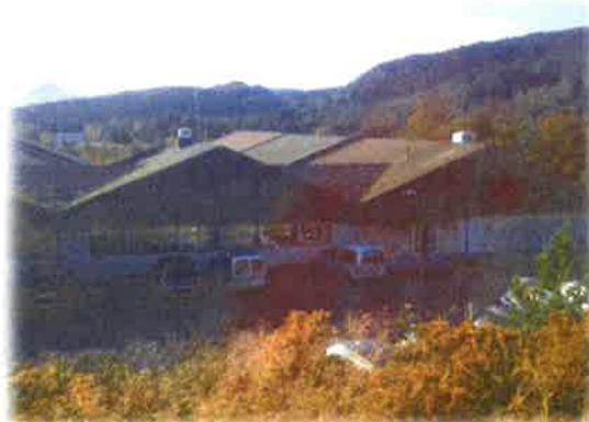
Bilde 15: Myrvåg Sjukeheim

Ein har problem med kaldluft som ikkje er kald nok frå ventilasjonsanlegget. Det skal også finnast eit lekkasjepunkt på taket som bør utbetrast.