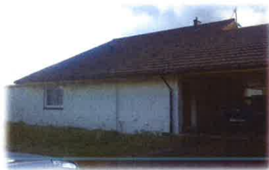
Bilde 22: Utvendig fasade

Konstruksjonsmessig er bygga hovudsakelig av betong, og på taket er det lagt takstein. I dag bur det to familiar i bygga. Det vart gjennomført ei utvendig synfaring av bustadane i tillegg til samtale med leiar drift.