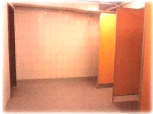
Bilde 5: Garderobar er i god stand

Garderobar ved gymnastikksalen blei pussa opp (flislagt i 2013) og er i god stand.