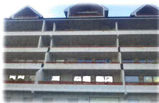
Bilde 21: Solberg terrasse

Solberg terrasse har i alt 15 leiligheiter. Kommunen eig 4 av desse leiligheitene og dei var tiltenkt til å brukast som gjennomstrøymingsbustadar for familiar i etableringsfasen, men vert i dag nytta til sosialklientar. Konstruksjonen er hovudsakelig av betong. Vedlikeholdsmessig har kommunen ansvar for oppussing sine leiligheiter m/terrasse både innvendig og utvendig. Det vart gjennomført ei utvendig synfaring av bustadane i tillegg til samtale med leiar drift.