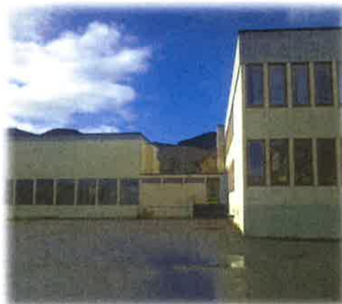
Bilde 3:Gymnastikksal og ungdomsskulebygg

Stokksund skule er ein kombinert skule med totalt 169 elevar på 1. - 10. trinn. På ungdomstrinnet er det i 2013 73 elevar, medan det på barnetrinnet er 96 elevar. Skulen har 28 tilsette medrekna lærarar, assistentar og administrasjon. Ungdomsskuledelen, med tilhøyrande idrettsbygg og symjebasseng, vart teken i bruk i 1974. Barneskulen vart teke i bruk i 1999. Bassenget vert i dag leigd ut til Sunnmørsbadet Fosnavåg AS