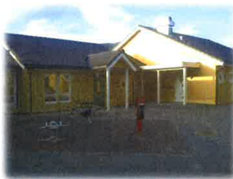
Bilde 9: Myrsnipa barnehage

Myrsnipa barnehage er lokalisert i Myrvåg. Den eldste delen av barnehagen stod ferdig i 1993. Den blei då bygt av foreldre med kommunal garanti der kommunen tok over drifta. Barnehagen vart deretter bygt ut for ca 3-4 år sidan. Konstruksjonsmessig er bygget hovudsakelig av tre bordkledning utvendig, med takstein på taket. Det er i alt ca 56 ungar som har plass i barnehagen i 2013.