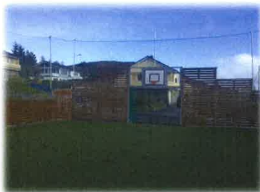
Bilde 25: Røra ballbinge

Viketoppen ballbinge og Røra ballbinge er begge relativt nye og i svært god stand. Det er kommunen som har stått som utbygger, men det vert hevda at det er grendelaga som skal ta seg av drift og vedlikehald av desse. Det er ikkje ført vedlikehaldskostnadar i rekneskapen til Herøy kommune på nokon ballbinge for kontrollperioden.