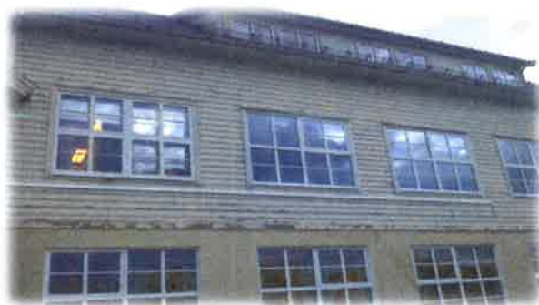
Bilde 6: Den utvendige fasaden er i svært dårleg stand

Vedlikehaldssituasjonen ved Nerlandsøy skule må ut i frå ei totalvurdering av interessentane sine svar og revisjonen sin gjennomgang vurderast som variabel. Den daglege drifta fungerer og er under kontroll, men ein ser etterskot på enkelte større vedlikehaldsoppgåver. Dette gjeld spesielt ei utbetring av utvendig fasade der utskifting av enkeltbord og maling bør prioriterast. I tillegg er ein plaga med lekkasje ved vindauga i sløydsalen og biblioteket. Ein registrete også ein takstein som var øydelagt på administrasjonsdelen. I tillegg finnast det enkeltbord på brakka som bør skiftast (roteskader). Det har vore skifta vindauge i hovudetasje og gymnastikksal for om lag 2 år sidan.