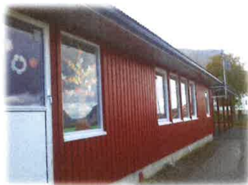
Bilde 11: Utvendig fasade Moltu barnehage

Vedlikeholdssituasjonen Moltu barnehage må ut i frå ei totalvurdering av interessentane sine svar vurderast som relativt god. Det har vore gjennomført ein del oppgraderingar i seinare tid. Blant anna utskifting av ventilasjonsanlegg, og utbygging av personalavdeling. Bygget var også beisa utvendig i samband med utbygginga. Vedlikehald som bør prioriterast er utskifting av lysarmatur. Leiar for drift hevdar at for å vere eit 40 år gammalt bygg er vedlikehaldet og tilstanden på bygget generelt godt, og ein ser ingen vedlikehaldsoppgåver som krev strakstiltak.